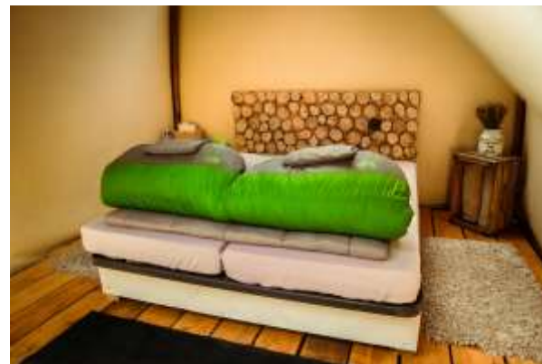
ALTI-DÔME « Nomade » 10m 2 – de 2 à 4 personnes