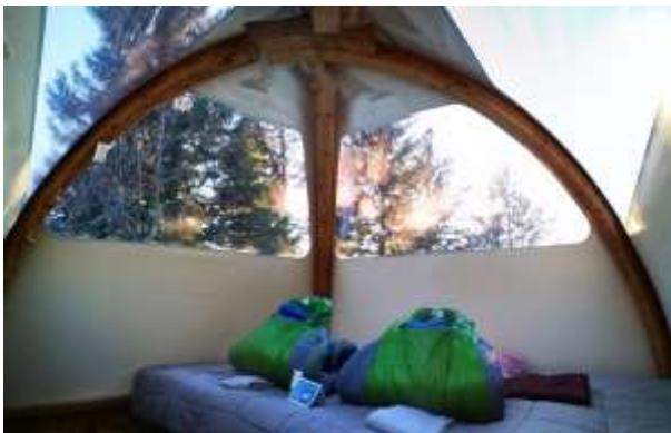
ALTI-DÔME « Panoramique » 10m 2 – de 2 à 4 personnes