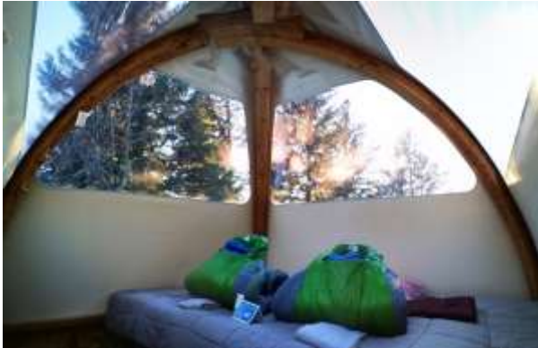
ALTI-DÔME « Panoramique » 10m 2 – de 2 à 4 personnes