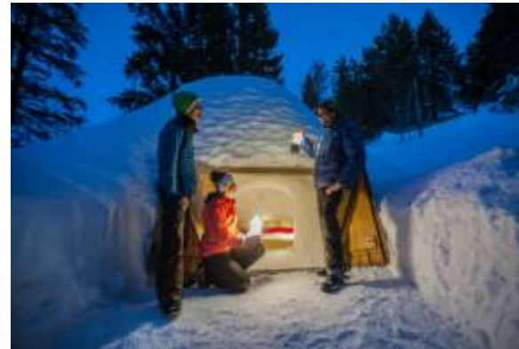
IGLOO « 100% neige naturelle » 7m 2 – de 2 à 4 personnes